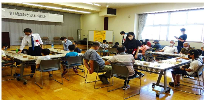
第11回安城七夕ふれあい将棋大会指導将棋の様子