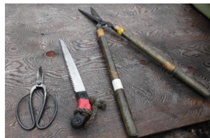
▲木バサミ、ノコギリ、刈込バサミ