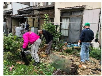
せん定、除草の様子