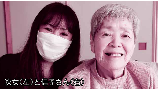
次女(左)と信子さん(右)

元々は孫と2人で生活していましたが、退院後は車いすでも生活しやすい次女のマンションへ転居しました。現在は訪問サービスや通所サービス、福祉用具などを利用しています。