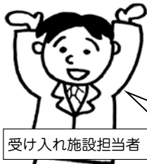
受け入れ施設担当者

参加者のみなさんがボランティアに来てくださり、いつもは口数が少ない利用者さんもニコニコと話されていたり、涙を流しながら「嬉しい、ありがとう。」と言っておられ、ボランティアさんを受け入れてよかったです。