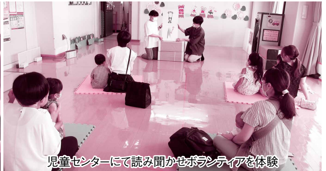
児童センターにて読み聞かせボランティアを体験