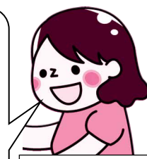
高齢者福祉施設で体験した高校生

初めての介護の世界で最初はとても緊張していましたが、利用者さんも職員の人も優しく接してくださって、楽しく体験ができました。私の将来の夢の中に介護福祉士が加わって、このプログラムに参加して本当によかったです。