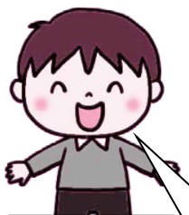
障がい者福祉施設で体験した中学生

昨年度は、コロナ禍の影響により中止になった日もありましたが、中学生から大学生、一般の人など90人が参加されました。参加者の声の一部を紹介します。