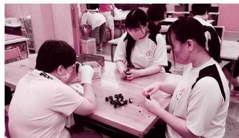
障がい者福祉施設で一緒に作業

初めてボランティアを体験しましたが、知的障がいなどを持っている人のイメージが変わりました。参加する前は、少し怖くて緊張していましたが、2日間利用者さんと関わることで穏やかな人が多いことや、施設には利用者さんにとって心地よい時間が流れていることを知りました。