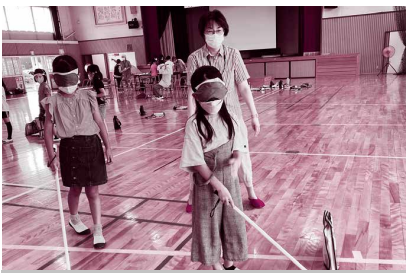
視覚障がい者ガイドヘルプ体験