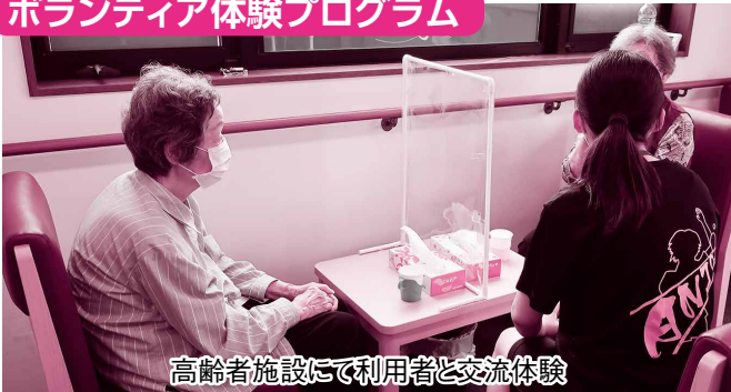
高齢者施設にて利用者と交流体験