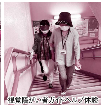
視覚障がい者ガイドヘルプ体験