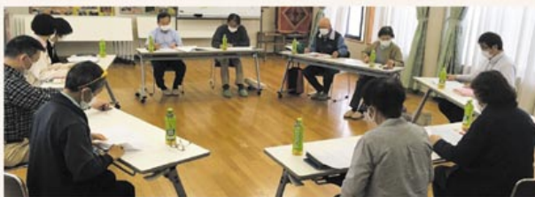
▲活動内容は定例会で情報共有