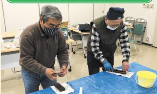
▲包丁やハサミの刃物研ぎ作業