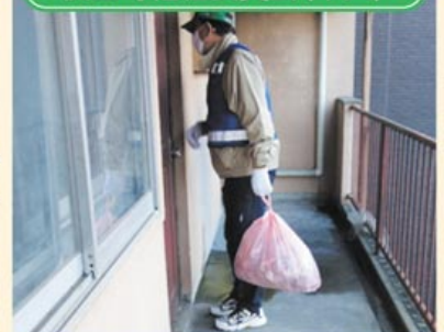
▲高齢者のごみ出し支援

私たちが暮らす地域の中には、ごみ出しや草取りなど、以前は自分でできたことが、年を重ねるごとにできなくなり、困っている人がいます。一方で、ちょっとした困りごとや心配ごとを抱えている人のために、自分の持っている技術や知識を活かして手助けをしてくれる人がいます。