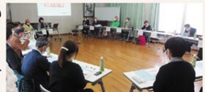
▲情報交換会の様子

また、当日は支え合い活動に関心のある他の町内福祉委員会にも参加していただきました。これらの委員会からは、「現在は個人的に庭木の剪定やごみ出し支援を行っている」といった意見や、「今後の活動を検討するために、加入している保険や作業の流れを教えて欲しい」といった質問も挙がり、活発な情報共有が行われました。情報交換の場をきっかけに、住民同士の生活支援活動による助け合いの輪が市内に広がっています。