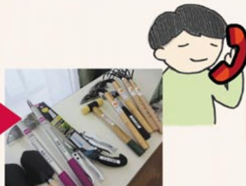
▲ささえ愛隊コーディネーターが各種調整し、必要な道具も準備