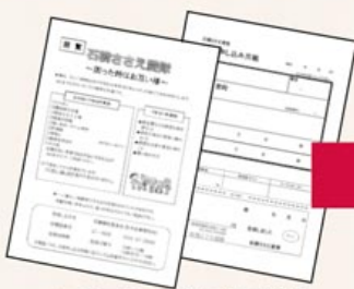
▲チラシを見て電話やFAXで申込み

利用者（住民）から依頼が入ると、石橋ささえ愛隊コーディネーターが依頼内容の確認、実施の可否の判断、作業ができる活動者の確保、現場の下見などを行い、活動者が作業に入ります。具体的な取り組みとしては、ごみ出しや庭の草取り、清掃、書類の代筆などがあります。こうした取り組みによって、日常生活の困りごとが解決されるとともに、困りごとを抱えた人と地域がつながるきっかけづくりとなり、住民が住み慣れた地域で安心して暮らし続けられることにつながっています。