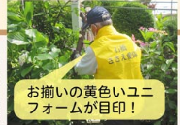
お揃いの黄色いユニフォームが目印！

戸建て住宅が立ち並ぶ団地で構成される石橋町内会（東山地区）は、高齢化が進んでいることから“ひとり暮らし高齢者”や“高齢者二人世帯”などの見守り活動に力を入れています。こうした活動を通して地域の高齢者に、ごみ出しや庭の清掃などの困りごとがあることに気づき、「何かお手伝いできないか」という話になりました。そこで、他市で先駆的に活動するお助け隊の活動を視察し、その後町内の全世帯にアンケート調査を行いました。その結果、要望の声が多かったことから、検討会や準備委員会で話し合いを重ね、令和2年に「石橋ささえ愛隊」が立ち上がりました。