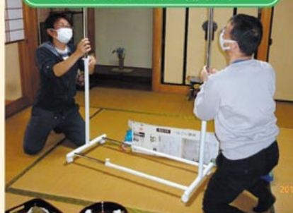
▲洋服掛けの組み立て作業