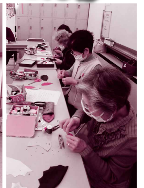
▲小物づくり講座(北部)

市内の各福祉センターでは、60歳以上の高齢者や障がいのある人を対象に生きがいづくりや介護予防、仲間づくりを目的とした講座を開催しています。陶芸や料理、体操など様々な講座を開催していますので、あなたに合う講座が見つかるかもしれません。次のページでは、「和裁講座」と「はじめてのズンバゴールド講座」に参加されている人へのインタビューや、各福祉センターの講座をご紹介します。