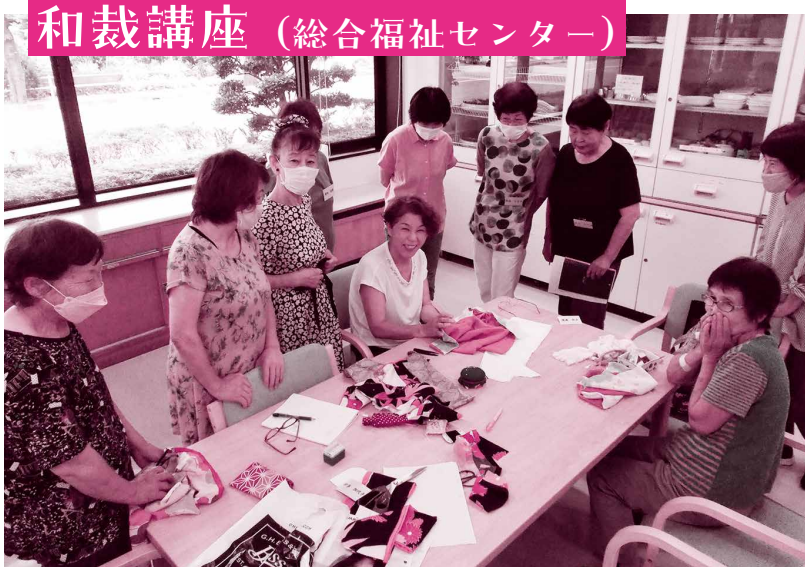
和裁講座 (総合福祉センター)

使わなくなった着物をリメイクする「和裁講座」と、ラテンの音楽に合わせて踊る「はじめてのズンバゴールド講座／前期」の参加者に感想をお聞きしました。