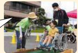
ボランティアとして 参加した学生さんの声