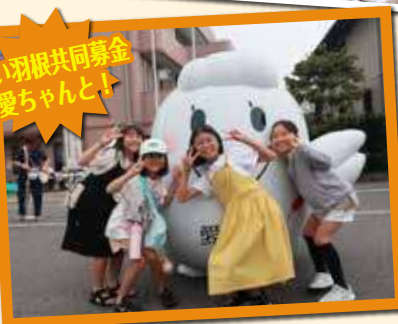
赤い羽根共同募金 愛ちゃんと!