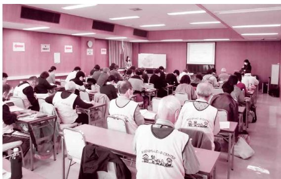
災害ボランティアコーディネーター養成講座の様子