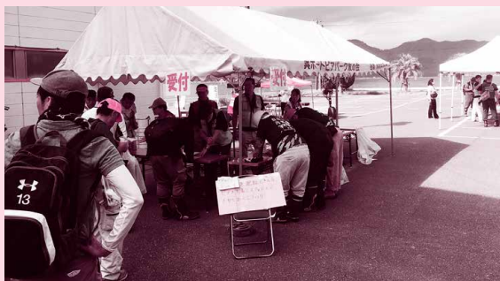
ボランティア受付の様子