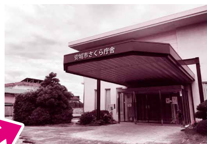
【設置場所(予定)】安城市役所さくら庁舎

災害ボラセンは、「被災地のためにすぐにでも何かしたい」「被災者を助きたい」という熱い思いをもったボランティア活動者に、現地の状況を正しく伝え、安全に活動していただくための役割を担っています。