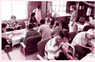
地域交流の場であるサロン活動