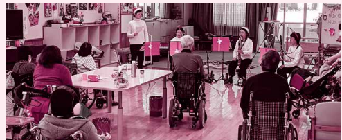
身体障害者デイサービスセンター