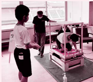
中学生防災隊防災教室