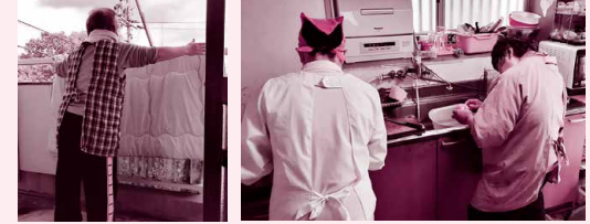
ホームヘルプサービス