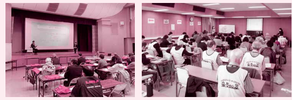
災害ボランティアコーディネーター養成講座