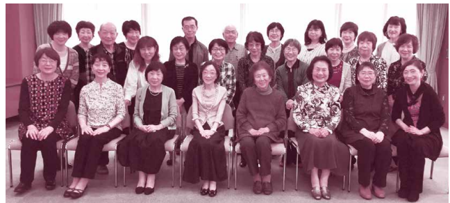
音訳ボランティアサークル安城ひびきの会のみなさま

活動を継続する中で、音訳に使用する機器だけでなく、「言葉」自体も変化してきました。みなさまに正しい情報をお届けするため、定期的に勉強会を開きながらスキルアップに努めています。原稿が多かったり、読み方がわからず大変なときもありますが、メンバーで助け合いながら楽しく活動しています。