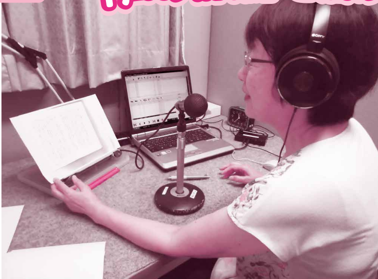
文章を音声データに変換(録音)