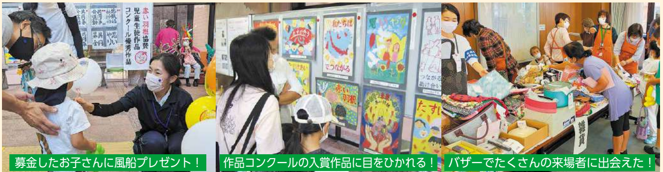
募金したお子さんに風船プレゼント！

例年好評のバザーや体験・展示コーナー、市内の福祉施設による自主製品の販売など、多くの団体に参加いただきました。来場者のみなさまには、各コーナーにおいて福祉に関するさまざまな体験をしていただき、楽しみながら福祉を身近に感じていただく機会となりました。