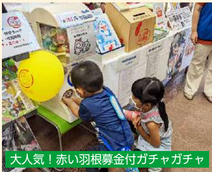
大人気！赤い羽根募金付ガチャガチャ