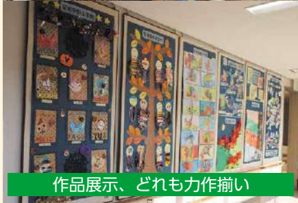
作品展示、どれも力作揃い