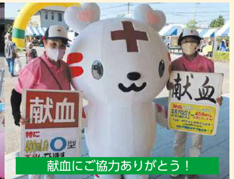
献血にご協力ありがとうございます！