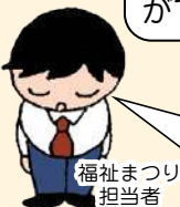
福祉まつり担当者

福祉まつり当日は、みなさまの願いが通じて一日晴天に恵まれました。参加団体や来場者のたくさんの思いがつながり、開催することが出来ました。みなさま本当にありがとうございました。