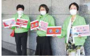
▲会場入口で参加者をお出迎える安城市の地区会長

年に4回、定例会議の後に交流会を設けています。行政や社協、地域包括支援センターの職員にも参加してもらい、和気あいあいとした雰囲気の中、関係機関との良好な関係づくりに取り組んでいます。