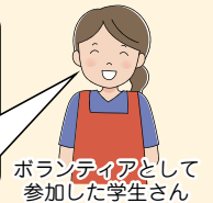
ボランティアとして参加した学生さん

消火体験のボランティアをやりました。子どもたちが笑顔で体験するお手伝いできました。また、ボランティアを通して防災への関心がわきました。