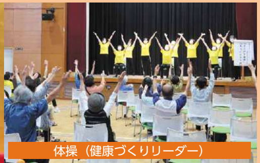
体操（健康づくりリーダー）