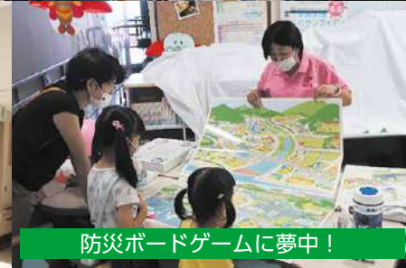
防災ボードゲームに夢中！