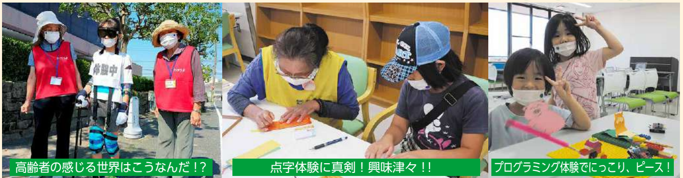
高齢者の感じる世界はこうなんだ！？