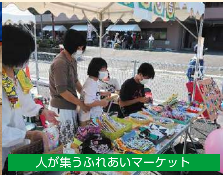
人が集うふれあいマーケット