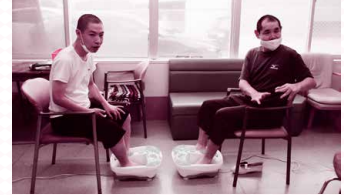
ジャグジー付き足浴