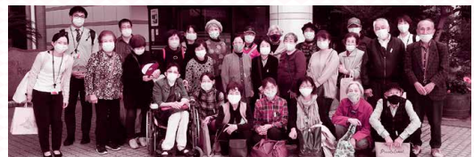
リフレッシュツアーに参加されたみなさま

参加者からは「日頃の大変さをお互い共感でき、困っていることに対しては良いアドバイスをいただきました」や「介護者ならではの視点で多くの人と話ができ、一緒に頑張っていく仲間ができたので励みになりました」との声をいただきました。