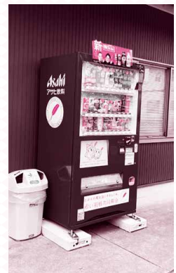
寄付金付き自動販売機

(※寄付金付き自動販売機を設置していただける企業・団体を募集しています。詳しくは以下の安城市共同募金委員会までお問い合わせください。)