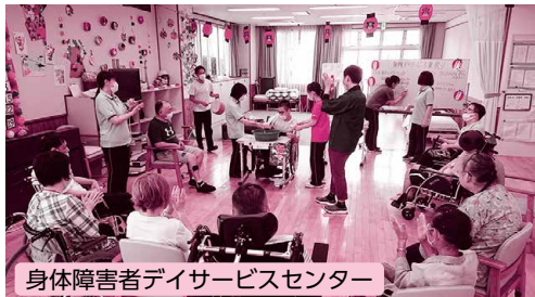
身体障害者デイサービスセンター