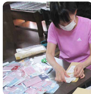
▲地域ふれあいサークルかんらんしゃ

マスクが不足した春から夏にかけて、「安城市民やろ MY プログラム実行隊」「花かご」「地域ふれあいサークルかんらんしゃ」などのボランティア団体や町内福祉委員会がマスクの作製を行いました。また、一部は安城市社協を通じて市内福祉施設に寄付されました。