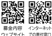
募金内容 ウェブサイト インターネットでの寄付窓口

写真は1月10日(日)の成人式で実施した、赤い羽根共同募金の募金活動の様子です。 今回の募金活動は介護現場で働く人の身体的負担を軽減し、働きやすい環境づくりを目的に介護補助スーツを購入するために実施しました。 当日は多くの新成人のみなさまやご家族から募金をいただきました。 募金は3月31日(水)まで社会福祉会館窓口またはインターネットで受け付けておりますので、ご協力をよろしくお願いいたします。詳しくは、安城市社協ウェブサイトをご覧ください。