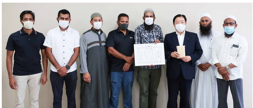
▲イスラム協会新安城のみなさまと安城市社協会長