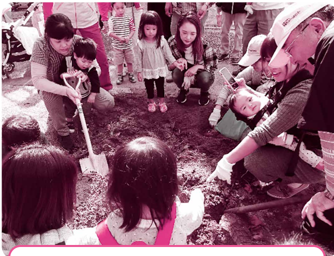
親子芋掘り体験に協力している様子 大きなお芋が土の中から出てきてびっくり!

「センターまつりで、来場者のみなさんに切り花や野菜を配布したときの喜ぶ顔が嬉しいです」「冗談を言ってみんなで笑いながら作業をしているとき、元気とやる気が満ちてきます」、「植物の育て方で知らなかったこともたくさん教えてもらい、勉強になります」など、グループの活動には、やりがいや楽しいことがたくさんあり、活動の輪が広がっています。