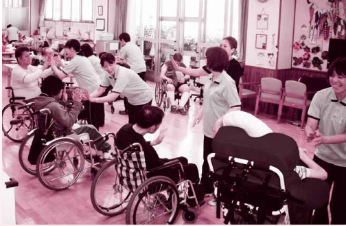
身体障害者デイサービスセンター