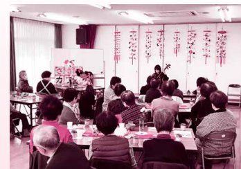
地域交流の場であるサロン活動