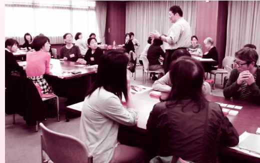
傾聴ボランティア養成講座