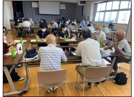
▲昨年度の地域福祉活動勉強会の様子