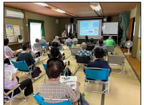
▲ハートフルケアセミナーの様子