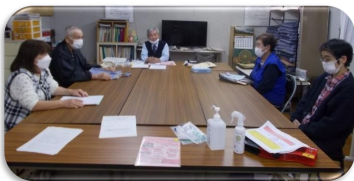
▲福祉委員会の様子

住民の方が、体調不良で出かけられないときは、ちょっとした買い物などを福祉委員が引き受けるなどの生活支援もしています。