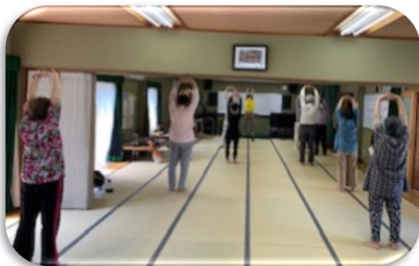
▲健康体操教室の様子

鹿乗福祉委員会は、3つのことをポイントに活動しています。①近隣の方々のいつもと違う様子等に気付かれたときは速やかに連絡をもらう。②福祉委員、組長、老人クラブ、民生児童委員等との連携を密にする。③ひとり暮らし高齢者や避難行動要支援者への声掛けや気配り、参加を促す。また、毎月、見守り対象の方についての情報交換をする。