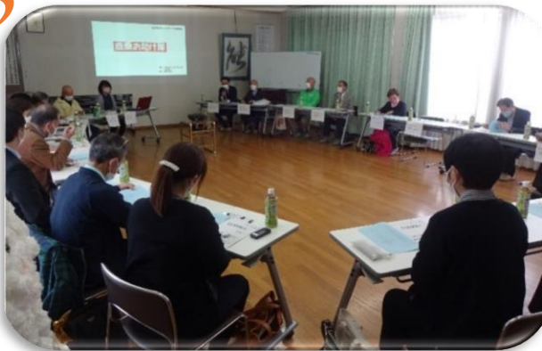
▲情報交換会の様子