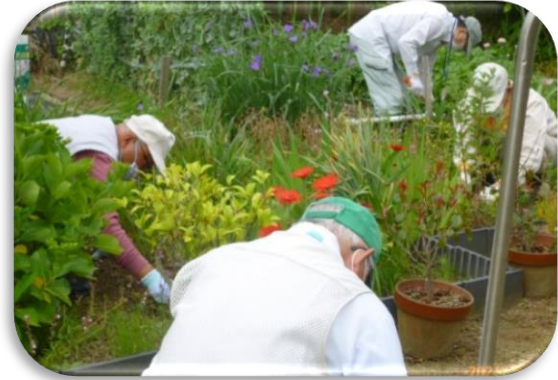
▲鹿乗お助け隊の活動の様子

10月27日(木)に、里町にある石橋公民館にて、生活するなかでの“ちょっとした困りごと”を住民同士で解決する活動を行っている、鹿乗お助け隊(桜井中学校区)と石橋ささえ愛隊(東山中学校区)と桜井・東山地区内の希望した他の福祉委員会のみなさんと情報交換会(生活支援ネットワーク会議)を開催しました。