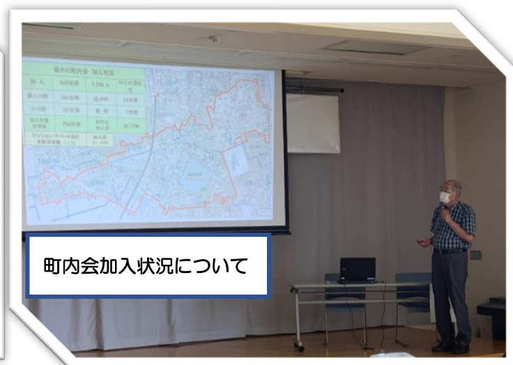
▲姫小川福祉委員会発表の様子