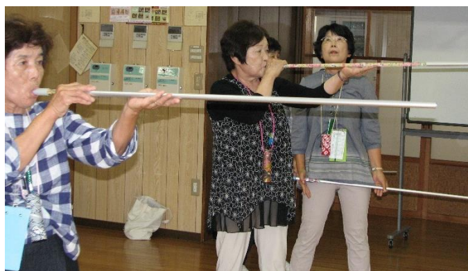
▲吹矢サロン活動の様子

桜井北福祉委員会では、2か月に1回の会議で、避難行動要支援者支援制度に登録されている方を委員会で共有し、日頃の見守りにつなげています。さらに、見守り対象者を決めるための話し合いをコアメンバーで行っています。