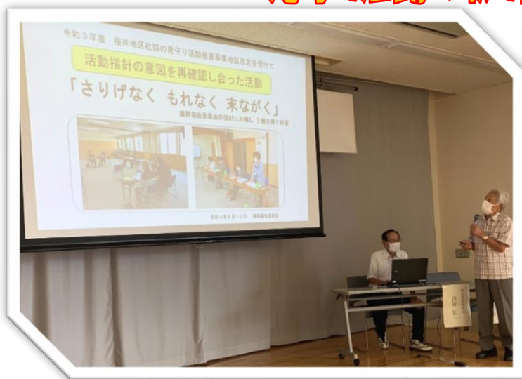
▲城向福祉委員会発表の様子