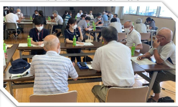
▲グループワークの様子▲

令和3年度に、桜井地区社協の見守り推進指定を受けた城向福祉委員会と姫小川福祉委員会の方に、見守り活動の取り組みについて発表していただきました。発表後に、見守り活動をするにあたって「困っていること」「課題に感じることをグループで共有し、課題等に対しての解決策を話し合い、全体で共有しました。参加者からは「訪問することでつながりができた」「福祉委員が毎年かわるがその分見守りの取り組みを知る人が増える」「手伝ってくれるボランティアを増やしたい」などの意見がありました。