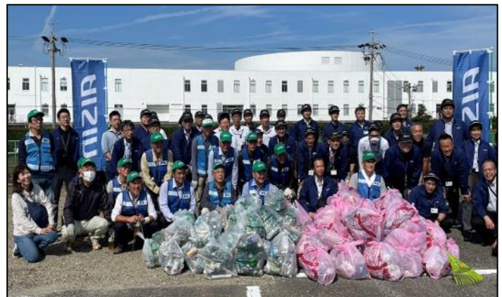
▲株式会社アイシン安城地区の皆様

長きにわたり、福祉委員会見守りグループとして、80歳以上の高齢者宅を訪問されるなどの見守り活動や生活支援活動をされました。また、町内の行事にも積極的に協力されるなど、桜井西町の福祉活動等にご尽力いただきました。