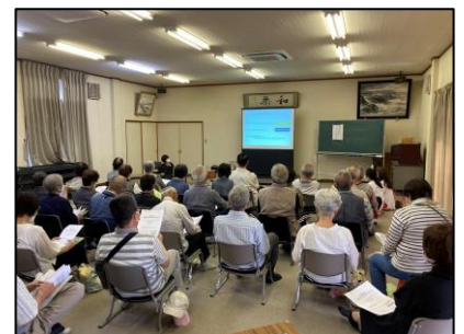
▲ハートフルケアセミナーの様子