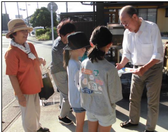
▲見守り家庭訪問の様子