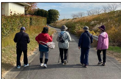
▲ウォーキングの様子