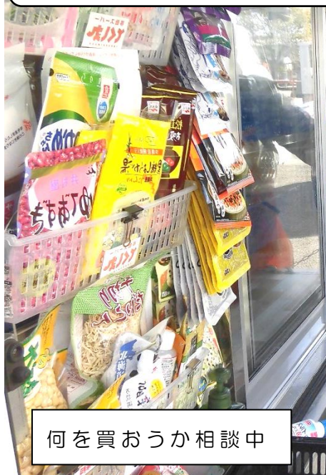
何を買おうか相談中