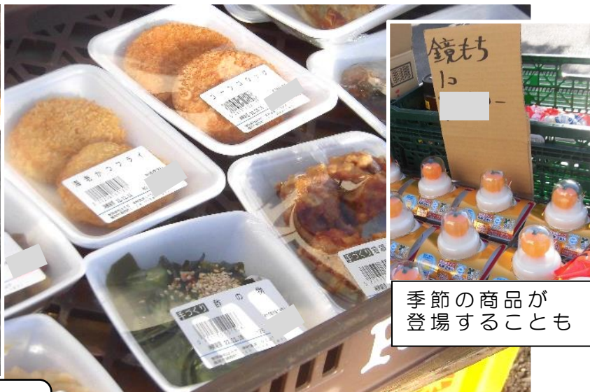
季節の商品が登場することも