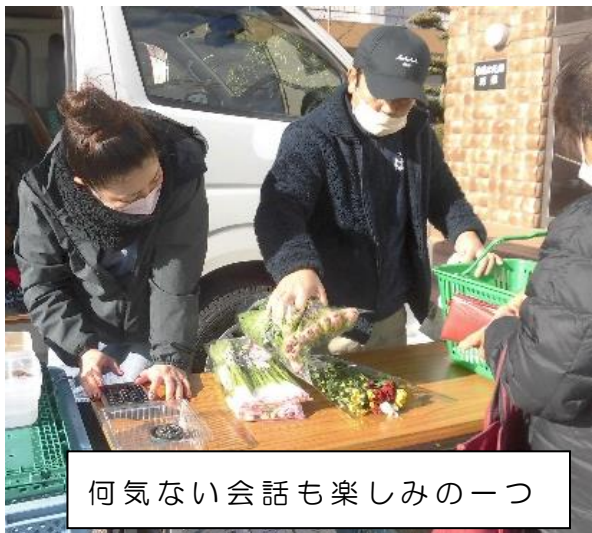
何気ない会話も楽しみの一つ