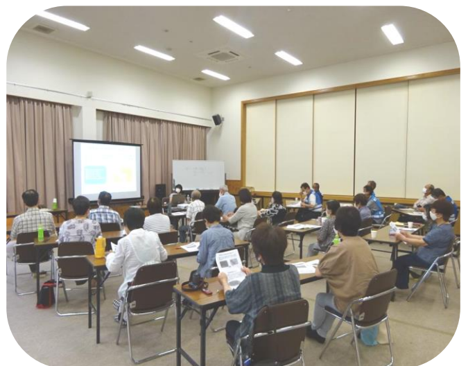
↑6/24 『高齢者の健康寿命を延ばす食生活』

講師への質問時間では、「血圧の数値について」など、日頃から皆さんが疑問に思っておられることについて教えていただける機会となり、とても有意義な時間となりました。