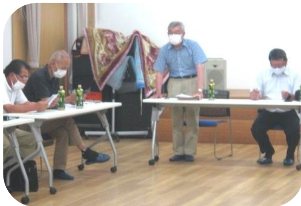
委員長による主旨説明の様子→

今回は、初回のため民生委員、老人クラブ、婦人防火クラブ、評議員の日頃の見守り活動の様子を話していただきました。それぞれの組織が、日頃の活動の情報を共有することができました。次回は、8月に開催予定です。