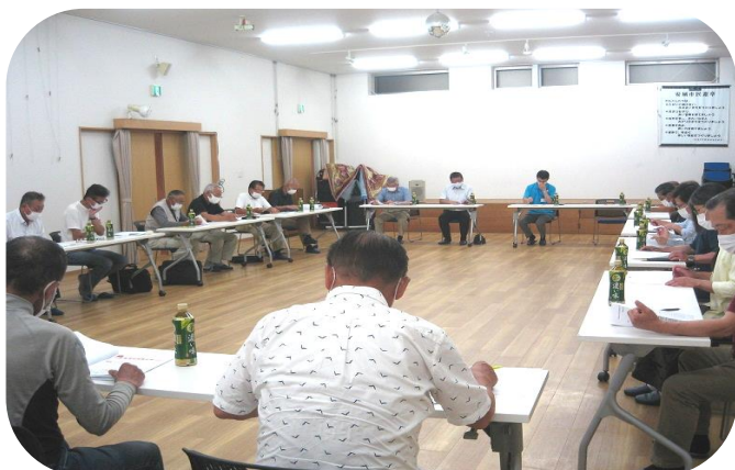
← 全体での情報共有の様子

今回は、初回のため民生委員、老人クラブ、婦人防火クラブ、評議員の日頃の見守り活動の様子を話していただきました。それぞれの組織が、日頃の活動の情報を共有することができました。次回は、8月に開催予定です。