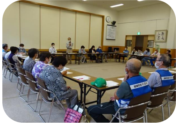
↑ 会長による見守り活動の現状報告の様子

前半では、町内会長より榎前町での見守り活動についての現状報告と、地域包括支援センター等の専門職による情報提供が行われました。