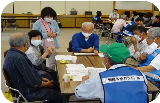
↑ 地区ごとに分かれての情報共有の様子

同じ地区の民生委員や評議員と世話焼きさんが、定期的に情報共有を図ることで、見守りの目を増やし、地域見守り体制の強化につながっています。