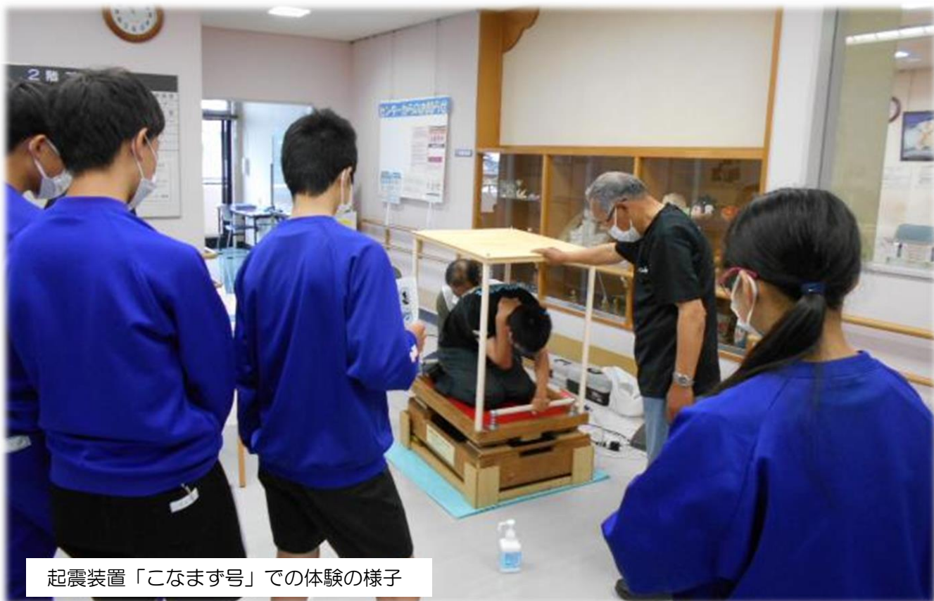
起震装置「こなます号」での体験の様子

5月21日（土）に西部福祉センターで中学生防災隊防災教室を開催しました。安城西中学校の生徒17名と学区内の各町内の自主防災会の方々が参加して、ミニ講話やさまざまな体験を通して地震について学びました。詳しい内容は、次ページで紹介します。