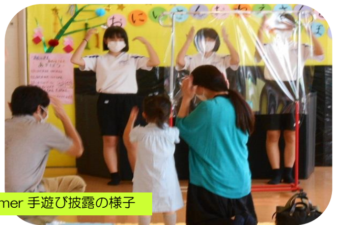
西部スペシャル in Summer 手遊び披露の様子