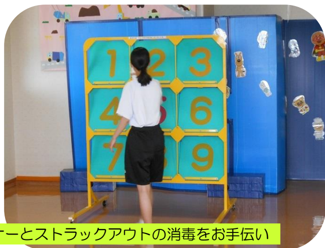
感染症予防のためにウルトラトレーナーとストラックアウトの消毒をお手伝い