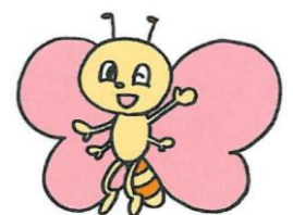
安城市社協キャラクターハートン