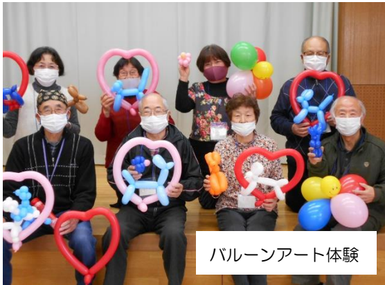
バルーンアート体験