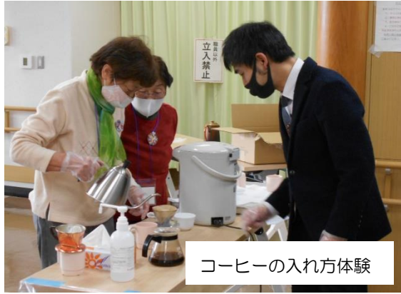
コーヒーの入れ方体験