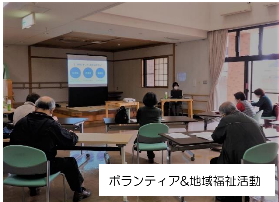
ボランティア&地域福祉活動