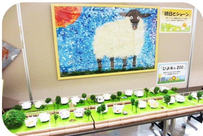
福祉事業所の利用者さんの作品① 施設で飼っている羊をモチーフにした作品。