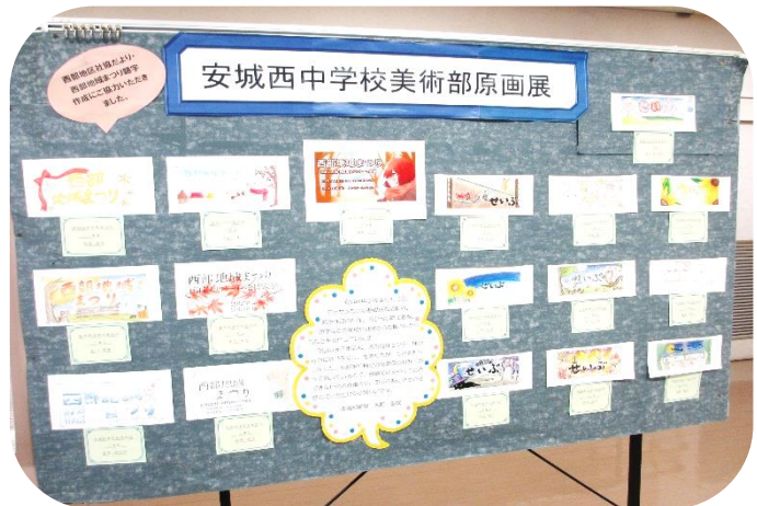
安城西中学校美術部による地区社協だよりの題字作品です。