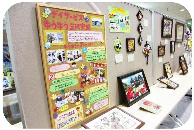
福祉事業所の利用者さんの作品② 壁飾りや木目込みなどいろいろな作品を展示。