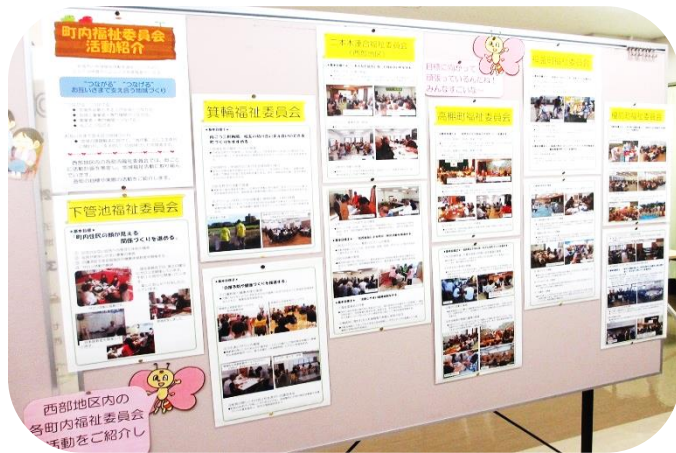
各町内福祉委員会の町内福祉活動計画や活動の様子を紹介しました。

今年も地区内の福祉事業所や各町内福祉委員会のみなさまにご協力いただき、作品展において、西部地区の各町内福祉委員会やボランティアグループによる活動をパネルで紹介しました。