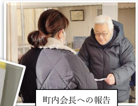
町内会長への報告