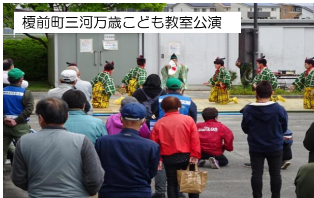
榎前町三河万歳こども教室公演