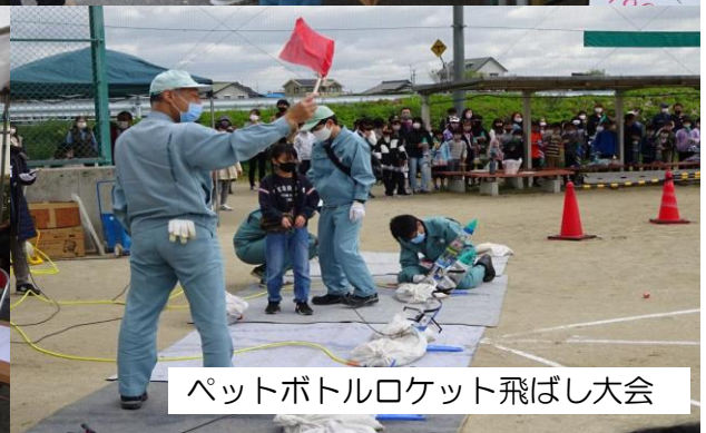
ペットボトルロケット飛ばし大会