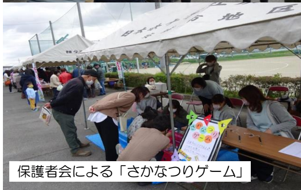
保護者会による「さかなつりゲーム」