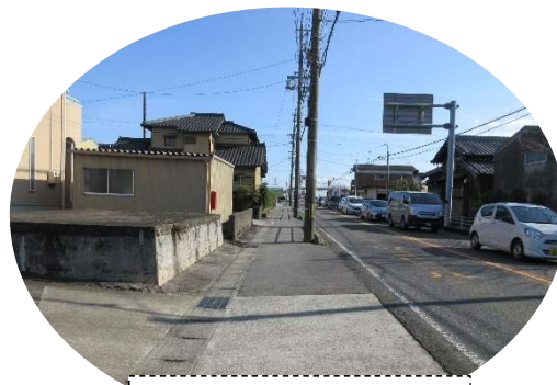
横断歩道を渡って一本道