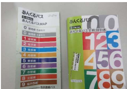
▲あんくるバスマップ（左） 全線の時刻表（右）

しかし、バスの時刻に合わせるのが面倒、行きたい所に行けない、乗り換えの方法が分かり辛い、といった理由からあんくるバスを利用したことがない人も多くいます。