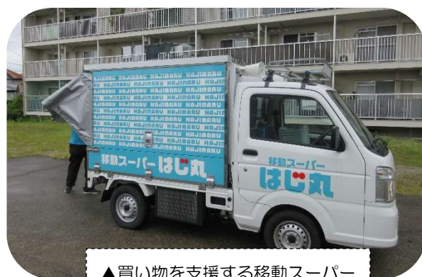
▲買い物を支援する移動スーパー

住み慣れた地域で長く暮らし続けるためには、買い物や通院など外出のための手段が必要不可欠です。しかし、自家用車の場合、高齢になるにつれて、判断能力や反射神経が低下し、運転に支障が出てきて免許を返納する人も増えてきています。一方で、免許を返納すると移動手段がなくなってしまい、生活がままならなくなるという理由で運転に不安を抱えながらも返納することができない人もいます。