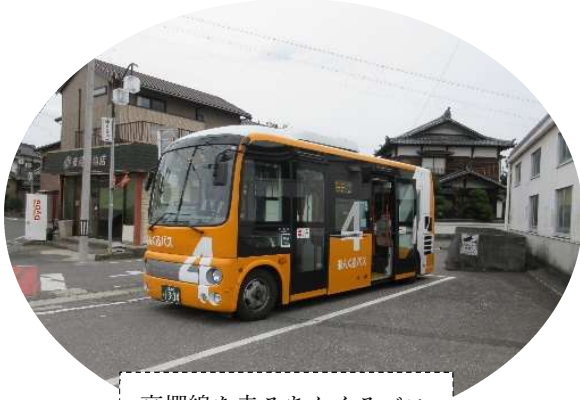
高棚線を走るあんくるバス