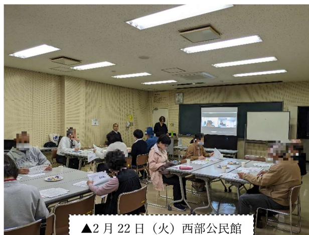
▲2月22日（火）西部公民館 で行われた会議の様子

名古屋大学の教授と、地域住民と一緒に、あんくるバスの利便性と、あんくるバス以外の移動手段について意見交換がなされています。会議では移動に関する課題を、自分にも起こりうる課題として捉え、我が事として考えることで、より暮らしやすい地域になるような話し合いが行われています。