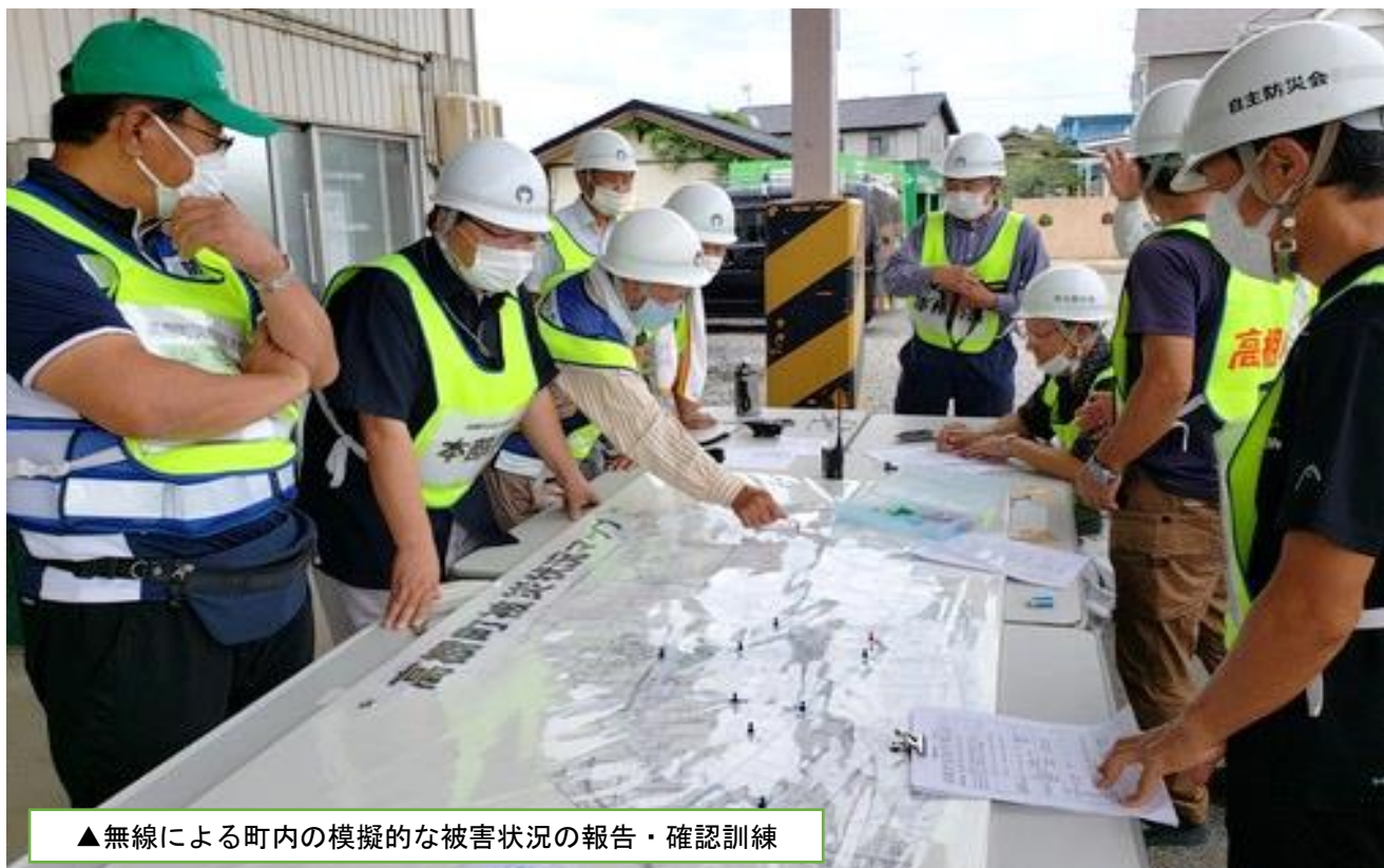
▲無線による町内の模擬的な被害状況の報告・確認訓練