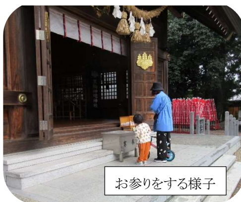
お参りをする様子