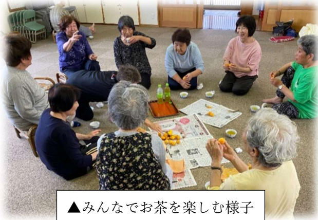
▲みんなでお茶を楽しむ様子

小栗会館は21年程前に地域の人々の協力によって建てられ、今でもこうして活用されています。