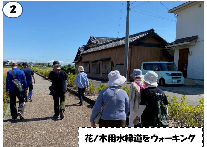
花/木用水緑道をウォーキング