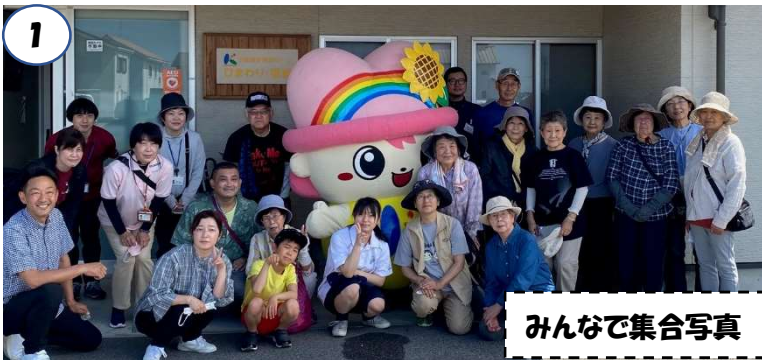
みんなで集合写真