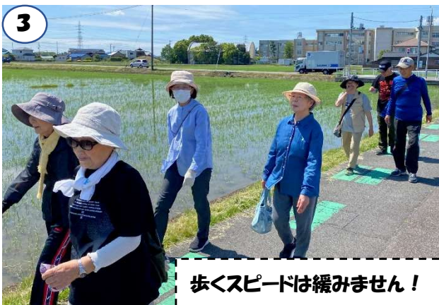
歩くスピードは緩みません！