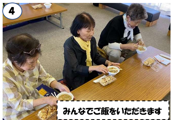
みんなでご飯をいただきます

5月20日（土）午前9時から医療法人愛生館主催の【健康ウォーキング】が開催されました。福釜町の小規模多機能ホームひまわり・福釜から特別養護老人ホームあんのん館・福釜までの往復約3キロの道を18名の参加者とスタッフが道中で交流しながら歩きました。ゴールすると、豚汁と五目ごはんが振舞われ、おいしそうに食べていました。食後は地域包括支援センターあんのん館による、認知症サポーター養成講座が行われました。