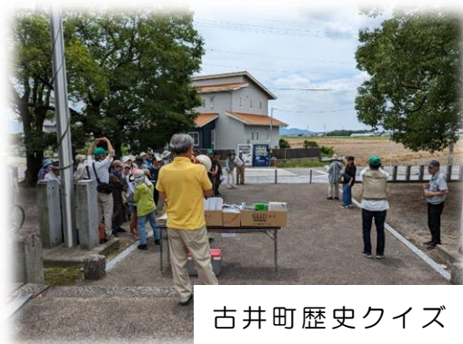
古井町歴史クイズ

6月24日（土）に古井町にて歴史めぐりが開催されました。当日は、天候にも恵まれ、33名の住民の方が参加されました。『歩いて見る・感じる・考える～ふるさと再発見～』と題し、古井神社や保福寺、安城城跡まで約2キロを歴史研究会のメンバーがガイドとなり、歴史の話を聞きながら歩きました。また、子どもから高齢者まで、様々な年代がグループとなり、歩くことで日頃、交流のない人とも交流ができ、ふるさとの魅力を再発見するよい機会となりました。