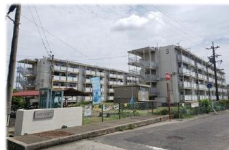
▲土器田町内会外観

今年度、土器田福祉委員会では、外国籍の住民との交流を深めるために国籍別の懇談会を計画しています。その第1弾として、8月22日（日）にベトナム国籍の住民との懇談会を開催しました。