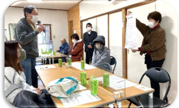
毎回話し合った成果を発表