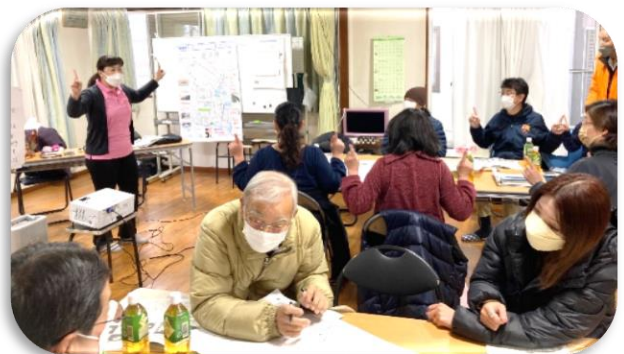
福祉事業所もワークショップに参加し、即興で行った、頭のリフレッシュ体操