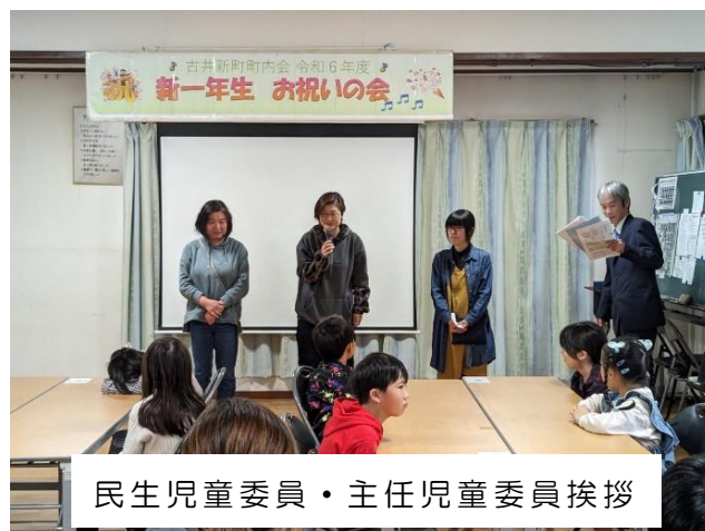
民生児童委員・主任児童委員挨拶