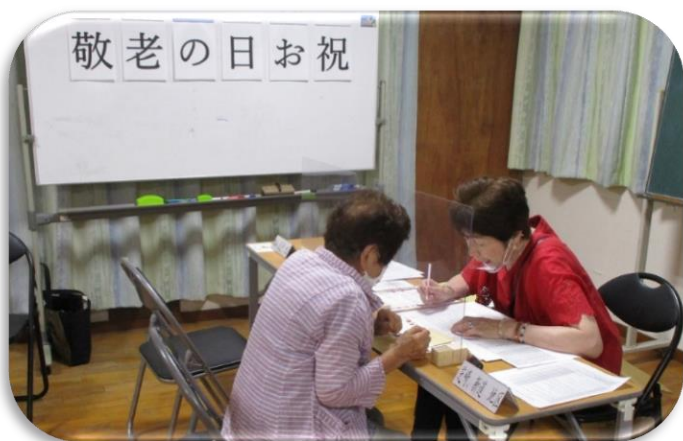
【イレブンチェックで近況把握】