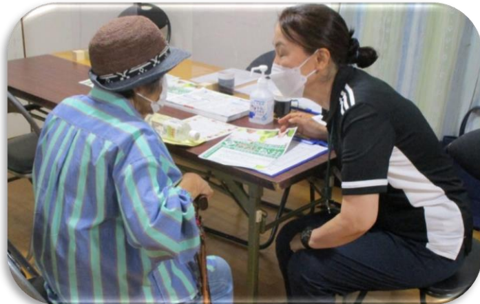
【地域包括松井による相談コーナー】

古井新町では9月18日（日）に、昨年に引き続き、敬老祝賀会に替えて、敬老祝い品の配付と健康状態の聞き取りを行いました。