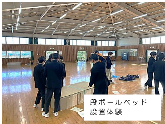
段ボールベッド 設置体験

防災に関する基礎知識の習得と体験を通じて学ぶことを目的に実施しました。参加した学生からは、「災害時には、トイレが使えなくなることが分かった。」「段ボールでもベッドができることが分かった。」「今日のことを生かしてお年寄りの人を助けたい。」「もし、災害になった時は、自分から動いてみんなのためになれるようにしたい。」など頼もしい感想を聞くことができました。