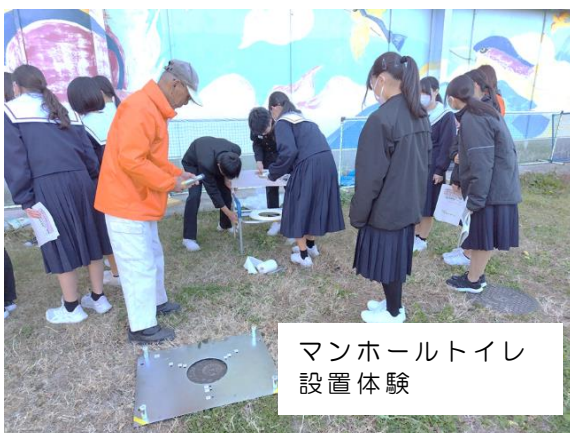
マンホールトイレ 設置体験