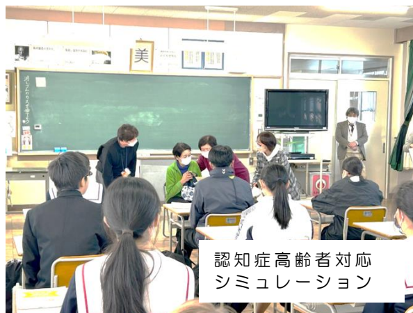
認知症高齢者対応 シミュレーション

当日は、チームオレンジあんじょう登録者の皆様に、認知症高齢者対応シミュレーションの寸劇や認知症予防体操にご協力いただきました。福祉委員のみなさんからは、「認知症は、誰でもなる病気だと分かった。」「困っている人がいたら積極的に声をかけてみようと思った。」「家で家族と認知症予防体操をやってみたい。」等の感想をいただきました。今後も、若い世代の方にも認知症を知ってもらえるよう、啓発活動を続けていきます。