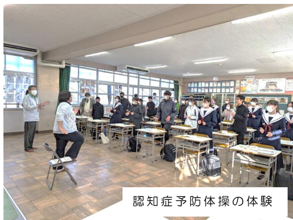
認知症予防体操の体験