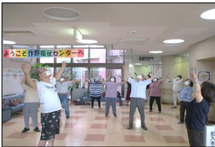
▲おそと de 体操（ラジオ体操）の様子

今回の測定会を通じて、参加された方には、健康意識の向上と骨の大切さを知っていただくことができました。