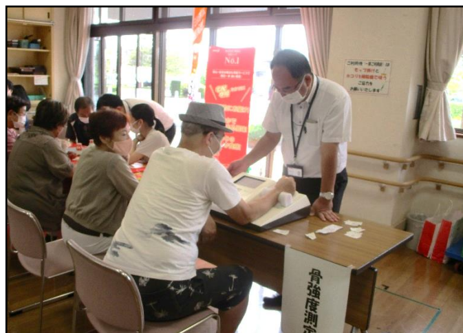
▲骨強度測定の様子