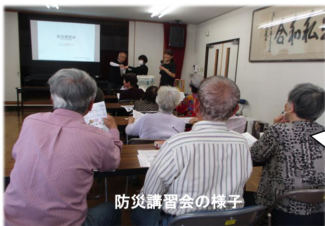
防災講習会の様子

参加者のみなさんには、地震が起きた時に自分や家族の身の安全を守るための対応について改めて考える良い機会になりました。