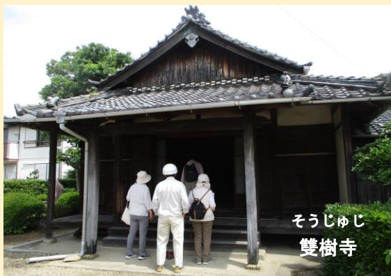
そうじゅじ 雙樹寺