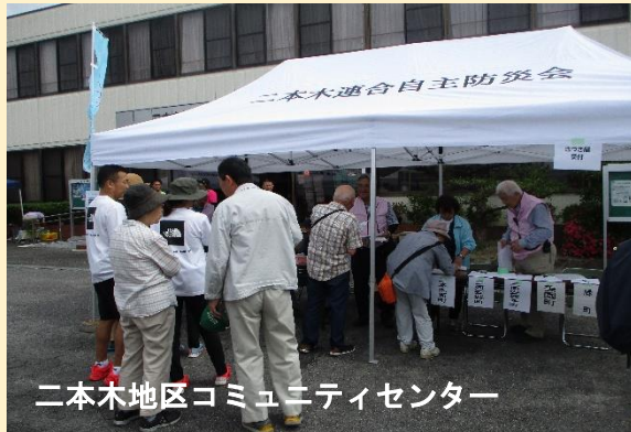
二本木地区コミュニティセンター

5月26日（日）に二本木連合町内会でふれあいウォーキングが開催されました。配布された地図を頼りに町内5カ所の公民館と11カ所の史跡を歩きました。回ったチェックポイントの数に応じて、「参加賞」「努力賞」「完歩賞」があり、参加者は自分たちの体力に応じたペースで楽しんでいました。