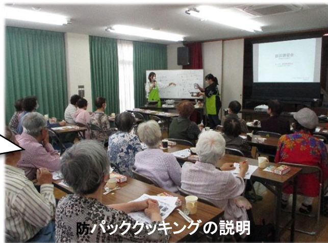
防パッククッキングの説明

耐熱性ポリ袋に食材を入れ、袋のまま鍋で湯せんする「パッククッキング」にサロンのスタッフが挑戦し、みんなで試食会もしました。