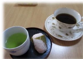
4月11日 桜餅と緑茶・珈琲