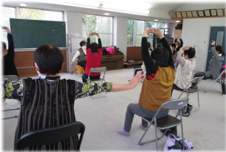
▲みんなで体操します