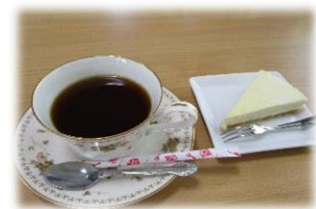
5月9日 チーズケーキと珈琲

作野地区社協では、デイサービスさるびあのように、地域福祉活動に協力して下さる事業所を募集しています。