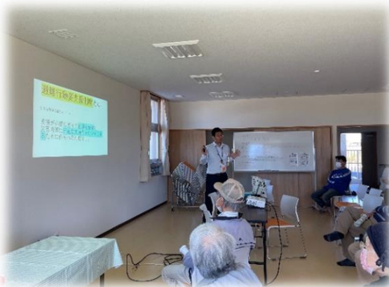
↑避難行動要支援者支援制度を説明。

※安心キットとは、避難行動要支援者支援制度に登録された方の安全を確認するため、医療情報や診察券の写しなどを収納する専用容器です。