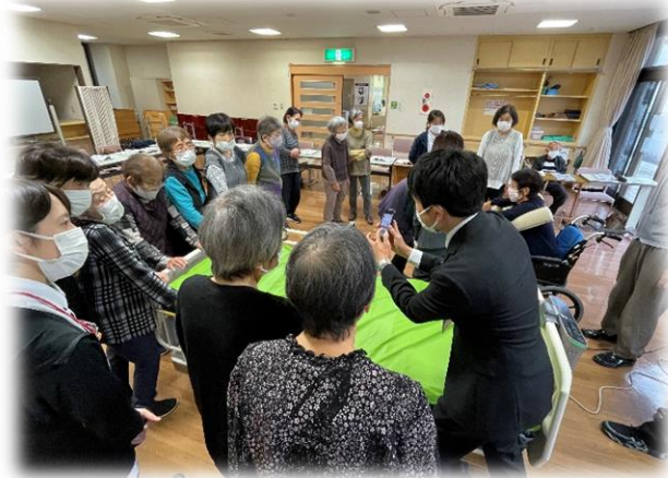
↑ スマホで操作できるベッドを紹介。

このような最新の福祉用具でもレンタルできることに参加者から驚きの声が上がっていました。値段等も詳細に説明していただき、大変参考になりました。