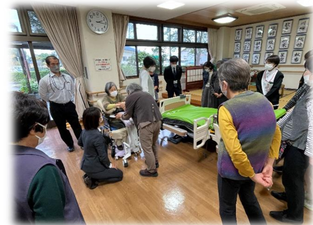
↑ 移乗ロボットを体験。