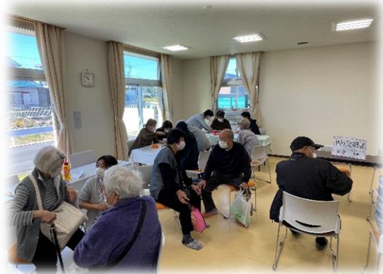
↑参加者間でお茶を飲みながら談話。