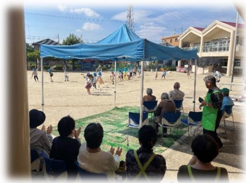
↑ お遊戯会を楽しむ参加者

思いがけないお遊戯会のご招待を受けた参加者の顔には自然と笑みが浮かんでいました。世代間交流の特別な時間となりました。