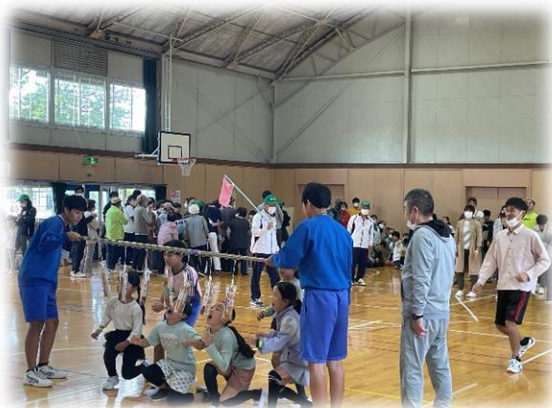
↑みんなでパン食い競争。

YES/NOクイズでは安城市社会福祉協議会のマスコットキャラクターの問題も出させていただきました！