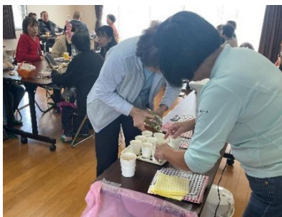
↑初日は満席で大盛況。スタッフの方も大忙しでした。

サロンとは地域で自主的に運営されている気軽に集まれる交流の場・仲間づくりの場のことを指します。「スマイルカフェ」のようなカフェ型サロンは住民の方同士で自由にお話することに重点を置いたサロンです。