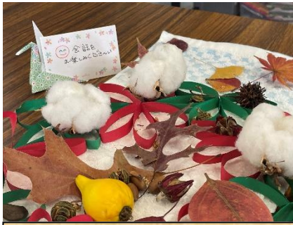
↑手作りの飾りは和やかな雰囲気づくりに役立っています。