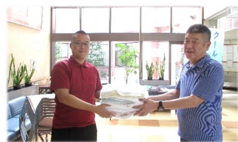
▲ぞうきんを手渡す住吉町内会長(右)と受け取る作野福祉センター館長(左)

「ぞうきんを縫う会」は、10年以上活動されています。参加されている方は、「うちは1時間くらい活動したら終わりのゆる～い会なの。無理しないで気楽にやってるの」、「ここに来てみんなとおしゃべりするのが楽しいの」と笑顔で話されていました。