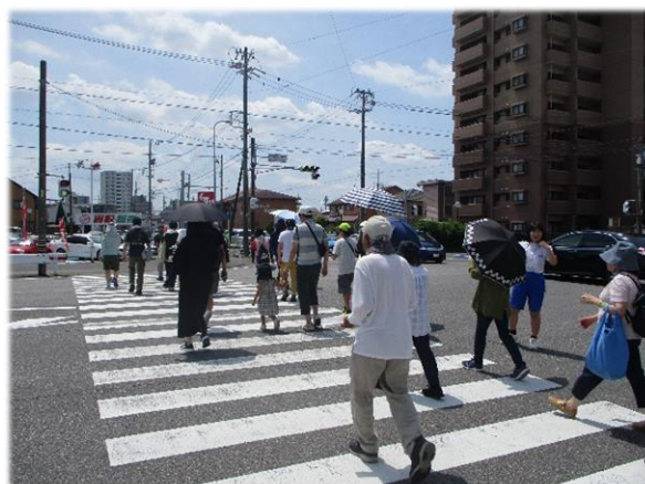
▲ウォーキングの様子

7月6日（土）に住吉町で健康ウォーキング大会が開催されました。梅雨の晴れ間の暑い日でしたが、参加者のみなさんは帽子や日傘、飲み物を持参し、熱中症対策をしながら元気に歩いていました。小さなお子さんから高齢の方まで幅広い年代の方たちが参加し、全員が無事にゴールまで歩ききりました。