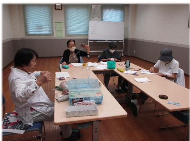
▲ぞうきんを縫っている様子

住吉町の「ぞうきんを縫う会」は、毎月第2水曜日に住吉町内会公民館に集まって楽しくおしゃべりをしながらぞうきんを縫っています。出来上がったぞうきんは、地元の小中学校や保育園、福祉施設などに寄付してみなさんに喜ばれています。