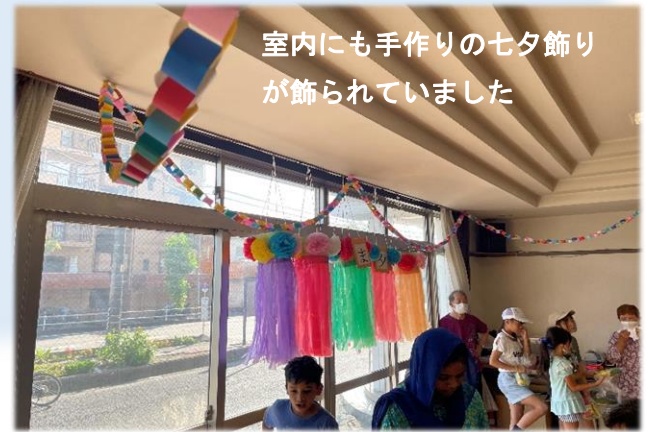
室内にも手作りの七夕飾り が飾られていました

7月17日（水）と18日（木）に依佐美・美園住宅の集会所で七夕まつりが開催されました。主催の「にこにこサークル」は、普段は高齢者向けにゲームや体操、脳トレなどを行っているサロンです。今回は、「小さなお子さんから大人まで誰でも参加できる夏のイベントが町内にあるといいよね」とサロンのスタッフが話し合っ七夕まつりを開催しました。当日は、大勢の子どもたちの参加もあり、みなさんが盆踊りや輪投げ、的あてなどのゲームをして交流を楽しんでいました。スタッフの方は「コロナ以降、子ども向けのイベントをするのは初めてで、子どもが集まるか心配だったけど、たくさん子ども達が来てくれて嬉しかった」と話されていました。