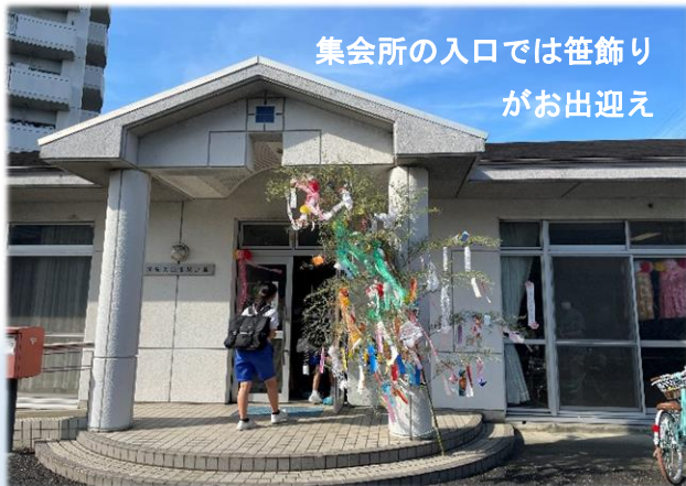
集会所の入口では笹飾り がお出迎え