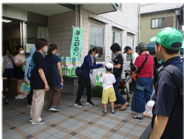
▲ゴール後の抽選会の様子