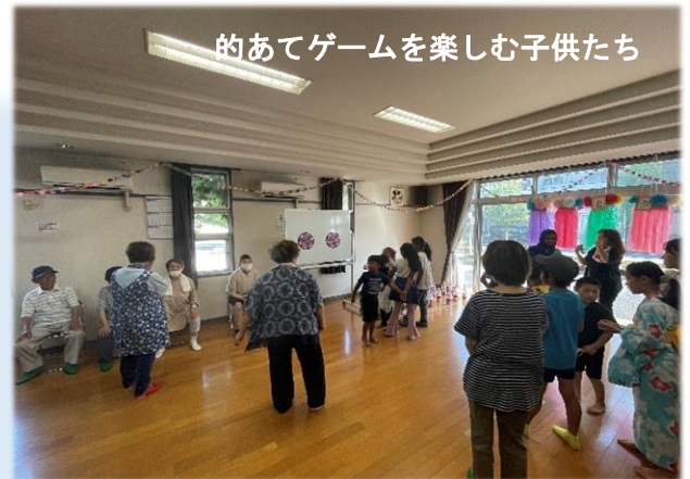
的あてゲームを楽しむ子供たち