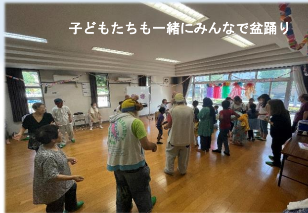
子どもたちも一緒にみんなで盆踊り