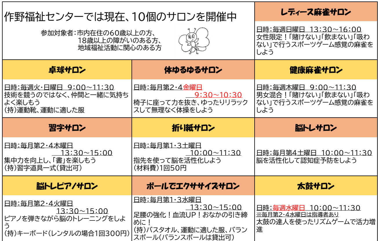
令和6年度 作野福祉センターサロン予定表