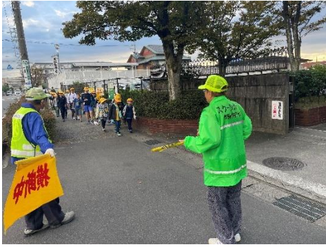
↑校門の前で元気に挨拶をしています。