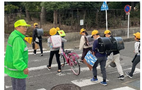
↑車通りも多い歩道なのでしっかりと見守りをします。