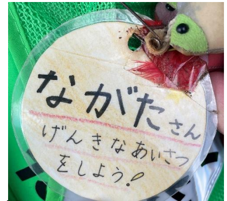
↑名札にも挨拶のことが記載されています。

永田氏：そう。あとはいろんな人とよく喋っていることが元気の秘訣かもしれないね。公園で喋ったり、月2回作野コミュニティで開催している茶話会（よってこ）に参加したりしてね。茶話会はとても良い。人と関わる場所は大事だと思っているもので私が「茶話会に来て！」と誘うことも多い。コーヒーが100円で飲めるし、いい会話の場所にもなる。