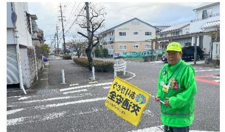
↑19年間この場所で子どもたちを見守っています。

——スクールガードを長くやっている中で、嬉しかったことや楽しかったことはありますか。